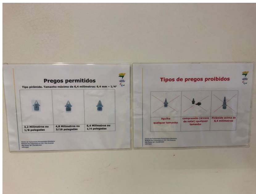
FIG. 3. PREGOS PERMITIDOS E PROIBIDOS